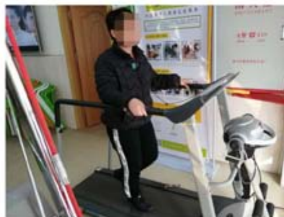
学员积极参与康复训练