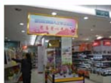
在超市设立爱心专柜