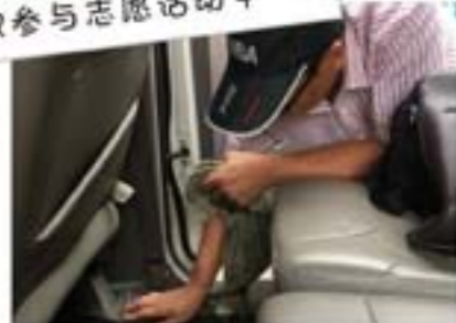
生叔洗车十分认真仔细