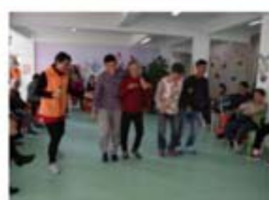
开心的趣味运动会