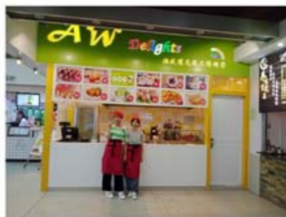
吉林大学第四饭堂AW港式小食店见习

针对有劳动能力的有就业需求的残疾人，实现多元化的庇护性就业，由工作人员以“一对一”或“一对多”形式开展，提升残疾人的自信心与自尊心，促进残疾人更好融入社区。