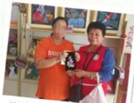
销售自己亲自做的手工艺品