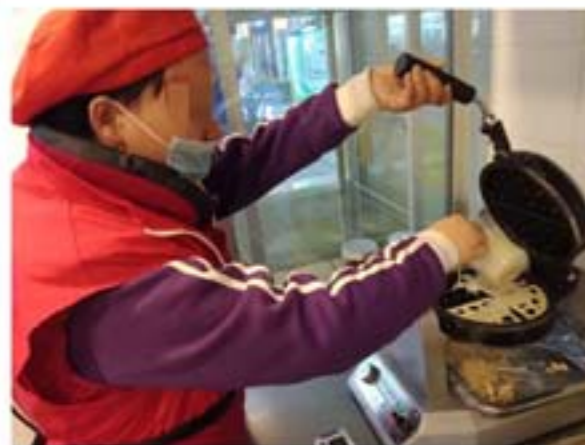
学员在小食店制作小食