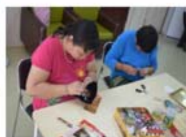
零钱包、手机袋制作