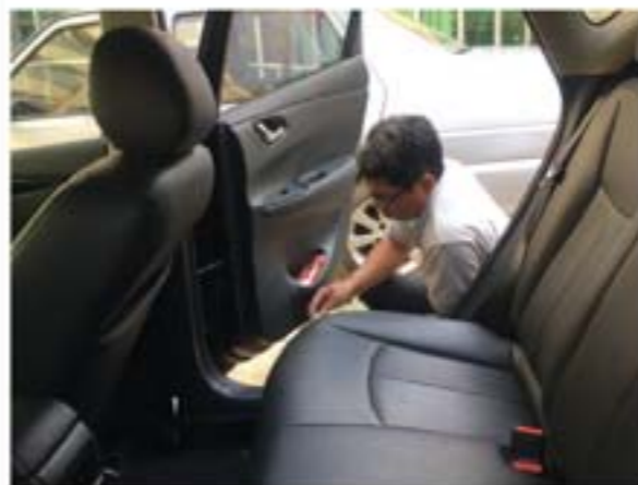
参与无水洗车项目