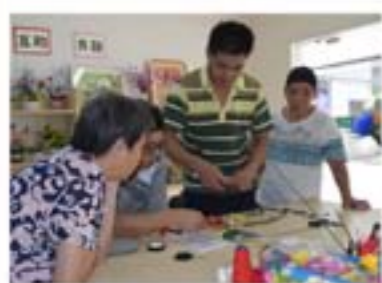
学员在探讨丝网花的技巧