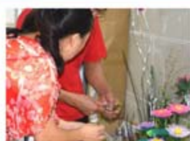
导师在做丝网花插花指导