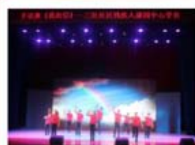
学员参加文艺汇演