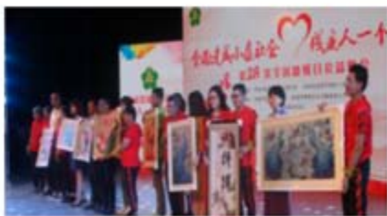
学员手工品作为赠品给爱心企业

在市场导向需求的前提下，结合残疾人的能力特点，开展系列技能培训，提高残疾人的职业技能，促进残疾人更好融入社会，实现其社会价值。