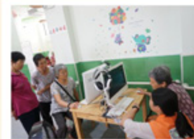
长者会员在学习用电脑 听歌