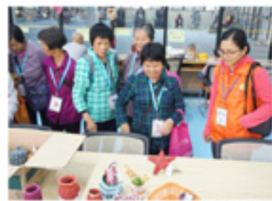
长者义工参观海澄站长者 的手工艺品