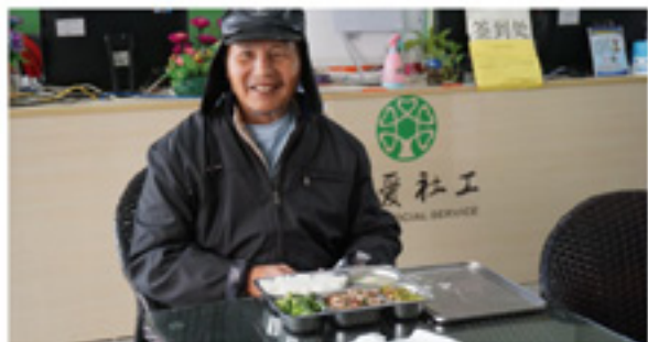
罗叔用微笑告诉我们他对午餐很满意