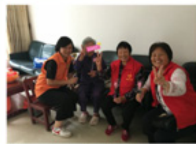
志愿队入户探访行动不便 较少外出的高龄长者