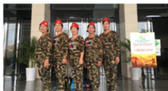
部分合唱队成员合影