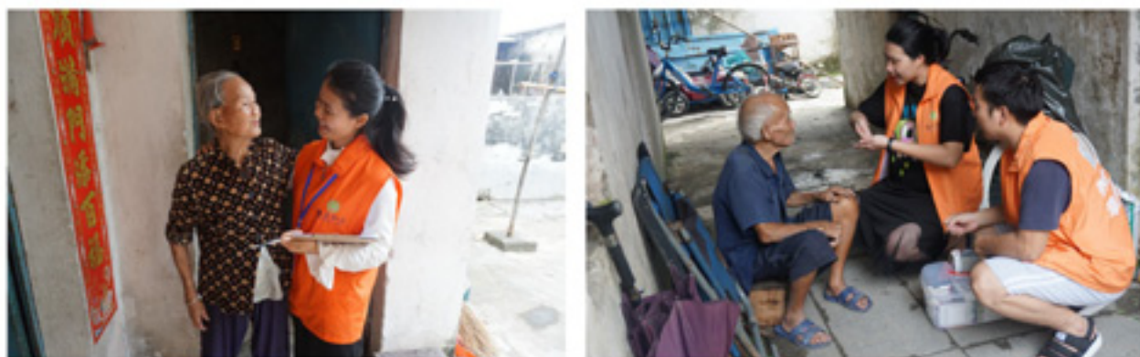
社工日常上门探访，慰问长者，缓解长者孤独等情绪，提升长者情绪健康

社工为社区80岁以上高龄长者和行动不便的长者提供定期上门探访服务、大学生志愿者入户读报等活动，并为有需要的长者开展个案服务，使因行动不便较少外出的长者得到社区的关怀和接触社会资讯的机会，有效缓解了长者孤独寂寞的负面情绪。