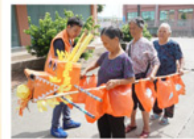
社工在为“龙舟”进行最 后的检查