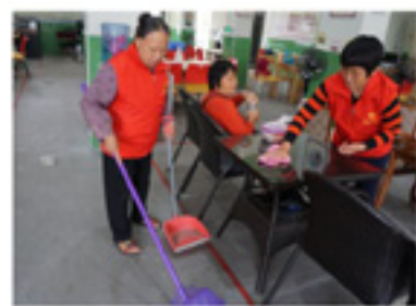
长者饭堂义工在清洁午餐后的站点卫生