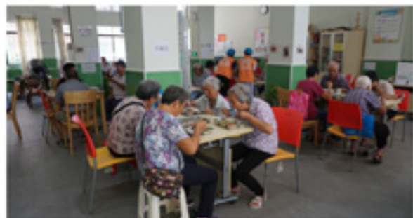
每天都有机会在吃饭的时候和不同的长者聊天说笑呢

站点于6月正式开展“社区长者饭堂”服务，为辖区内红旗户口60岁及以上的长者会员提供健康营养午餐，共有 100名 长者在本站点提交用餐申请登记，日均用餐人数有30人，共计用餐达 2490人次 。餐膳菜式一肉一荤一菜一汤（ 15元餐标 ），普通长者自付5元，特殊长者自付2元，营养又实惠的这项服务受到长者的广泛欢迎，解决了独居老人的用餐困难。