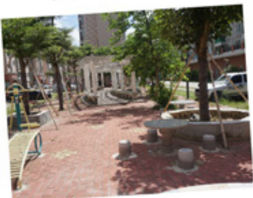
二期公共健身场所