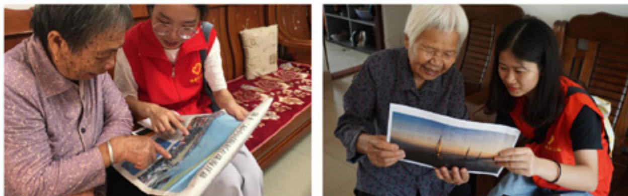
大学生志愿者入户读报，为长者带来最新的社会资讯