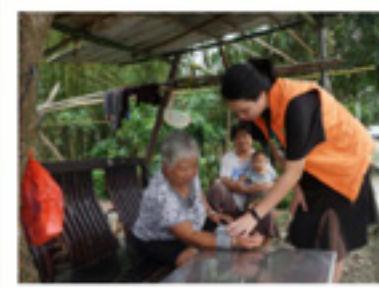
入户为长者监测血压