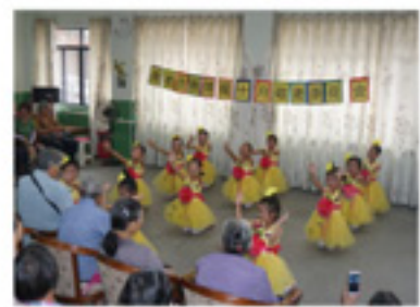
幼儿园小朋友给长者进行 表演