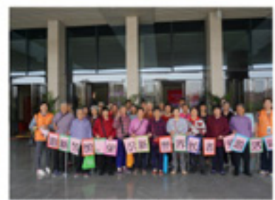
外出参观图书馆的新变化 跟上时代的脚步