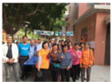
“健康乐活”乒乓球比赛

项目团队围绕“参与”服务方向，鼓励长者积极参与站点活动，结交朋友、学习知识。站点开展各类节庆活动、会员大会等发挥长者决策及管理能力， 本年度开展节庆文娱活动20场，共计966人次参与，唱歌、识字、邻里互助、脑退化知识等兴趣及发展性小组，共计231人次参与。 根据签到表统计，站点日平均会员签到60人，最高峰能达 100多人/天 ，且每场社区活动出席的会员的参与率均达到 95% 以上。站点已日益成为充满活力的“金山花园长者俱乐部”，每天都能看到长者的笑颜！