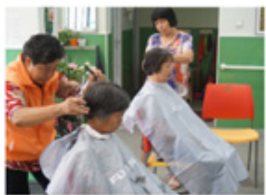
幸福睦邻情·爱心义剪