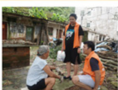
入户跟进长者的身体情况