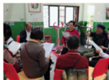
“银铃好声音”长者唱歌 小组