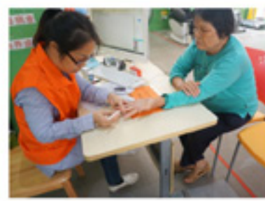
协助长者监测自己的血糖