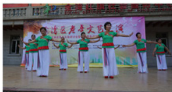
长者舞蹈队在红旗进行老年文化汇演