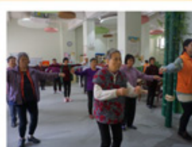
每日的活动筋骨早操