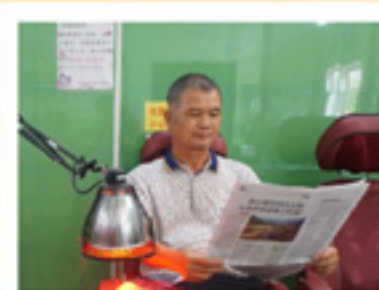
照灯的时候也不耽误看报纸的时间哩